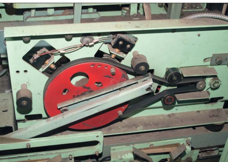
Редукторный привод дверей кабины, в котором часто выходит из строя ремень

большое их количество, которое было в ЗИПе, быстро закончилось. Но мы оперативно нашли изготовителя из Сергиева Посада, который по нашему запросу наладил выпуск ремней. Эту задачу мы решили, проблему сняли. Но нам просто повезло, что удалось отыскать производителя нужных нам ремней.