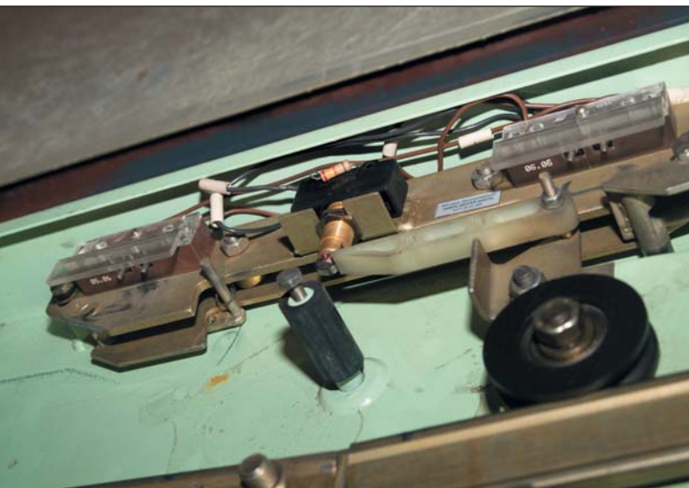
Замок дверей шахты. Если на контакты попадет пыль – а она туда попадет обязательно – контакты греются и выходят из строя