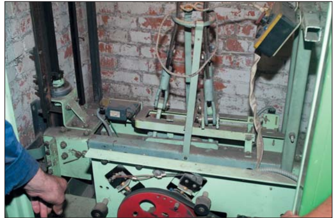
Вот на этом месте механик и должен стоять на одной ноге, чтобы выполнять работы на дверях шахты

Особенно остро проблемы с могилевскими лифтами стояли в первые месяцы эксплуатации, сейчас